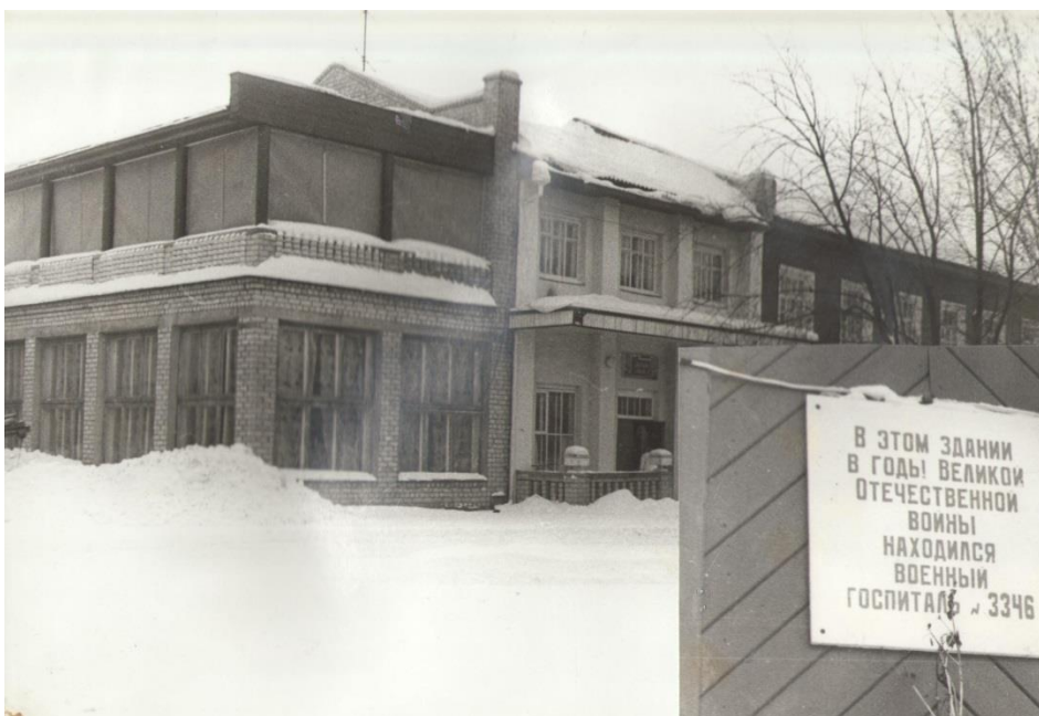
Эвакогоспиталь № 1361 прибыл 18 июля 1941 года и разместился в Доме культуры Сокольского ЦБК и школе №3 (педколедж);