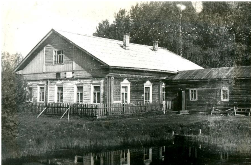
Бывшая усадьба Горка. После революции - начальная школа.

«Люби и распространяй просвещение: оно славнейшее подспорье благонамеренной власти, народ без просвещения - есть народ без достоинства» - так писал великий русский писатель В.А.Жуковский.