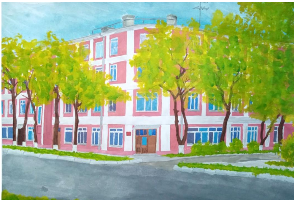
Кудашов Кирилл 14 лет "Детская библиотека"

У каждого из нас есть период в жизни, который вспоминаем с большой теплотой и сожалением, что ушел безвозвратно. Это - школьные годы. В школе научили читать, писать, познавать мир, в который входили по мере взросления, становились грамотными, образованными.