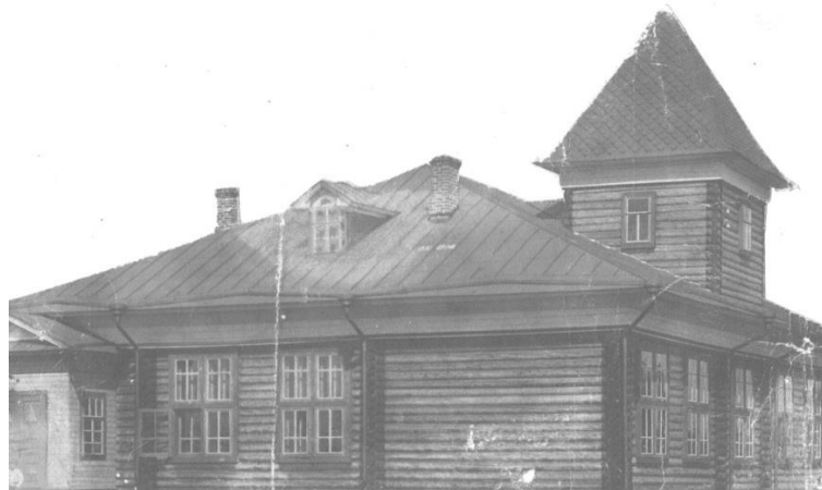
Школа при фабрике Сокол. (Первая школа)