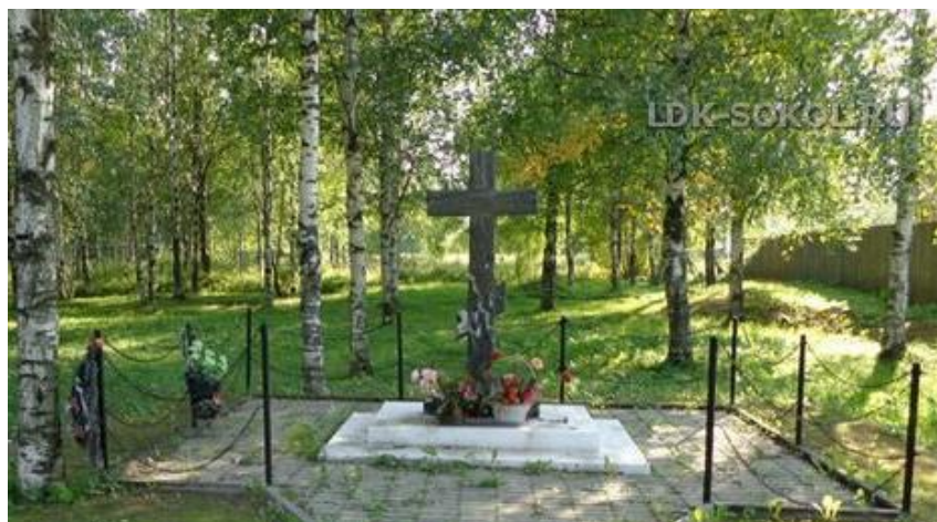
Поклонный Крест на месте захоронения раненых 1941 год г. Сокол, улица Школьная.