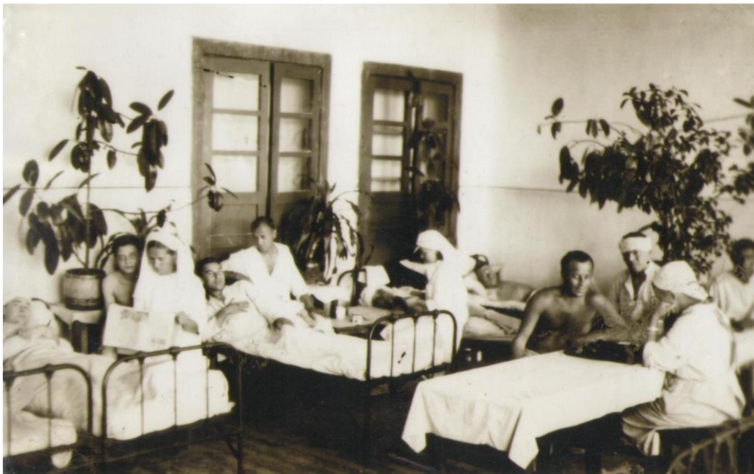
ЭГ 1539 Палата 1 хирургического отделения.

Из воспоминаний Е.П.Ильиной: «Мы переносили раненых на носилках вдвоем, с помощью лямки через плечо. Было очень тяжело. Вес раненых увеличивал, наложенные гипсовые повязки...»